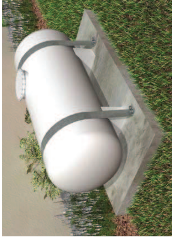
Renforcement du support et de l'ancrage de la cuve

► A défaut, le renforcement du support et de l'ancrage de la cuve ou du réservoir sur ce support, doit être entrepris.