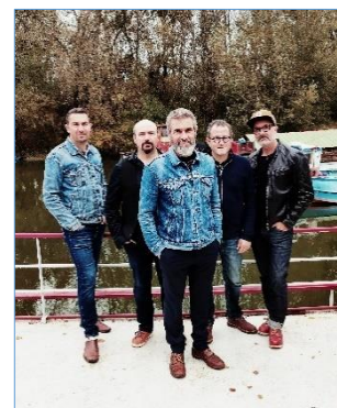
Mockingbirds and the Blues Committee