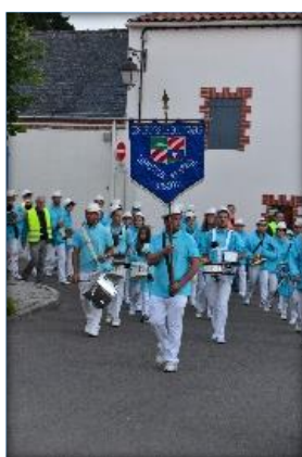
Fanfare des Jeunes de Bourgneuf