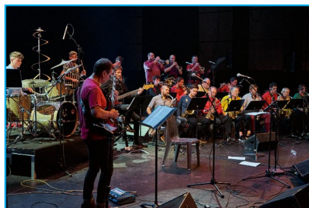
The Big Band - École de musique Saint-Brévin